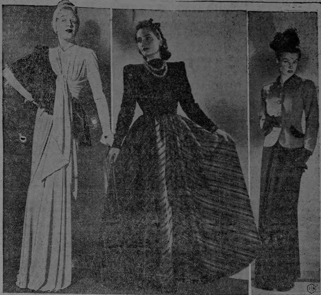
Las nuevas creaciones para comi- gos y cuello altos. Presentamos aquí peado, otro de voluminosa falda, y das se destacan por sus mangas lar- tres preciosísimos modelos: uno dra un conjunto de pijamas y chaqueta.